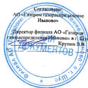
Схема газоснабжения д.Лукоино Пучежского муниципального района